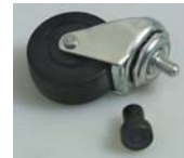
96422 RUEDAS DE REEMPLAZO PARA CAMILLAS DE PLÁSTICO DE BAJO PERFIL. 2" Resistente al aceite rodillo ofrece un deslizamiento silencioso y fácil incluso en superficies rugosas. Incluye tapa para tuerca. Especificaciones: Rueda: 2" Altura, 2 1/4"