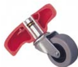
92132 RUEDA ENCAJABLE PARA CAMILLAS PLÁSTICAS. 2" Rueda de uretano, resiste corrosión. Anillo de metal comprime el tronco de la rueda para mantenerlo en lugar, aun así, lo afloja cuando peso es aplicado. Especificaciones: Rueda: 2" Altura, 2 3/4"