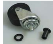
96132 RUEDAS DE REEMPLAZO PARA CAMILLAS DE ACERO DE BAJO PERFIL. 2" Resistente al aceite rodillo ofrece un deslizamiento silencioso y fácil incluso en superficies rugosas. Incluye tapa para tuerca. Especificaciones: Rueda: 2" Altura, 2 1/4"

99802 Rodillos de plástico de ingeniería para camillas de madera. Peso de Embarque: 5oz.